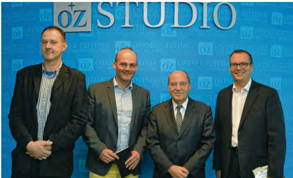
Die Tatverdächtigen der OZ